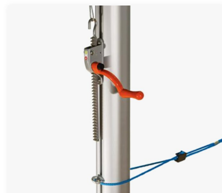
Poteaux de volley Haute-compétition GES