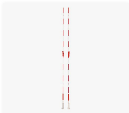
Mire de volley de compétition Approuvé FIVB