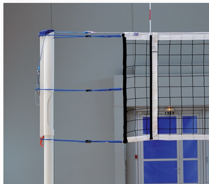
Filet de volley haute compétition GES