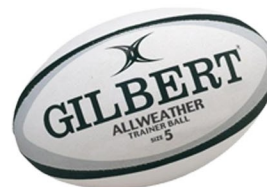
Ballons de rugby