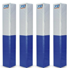
Poteaux de Rugby