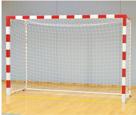
Buts de handball compétition acier peint bicolore avec barre de stabilisation