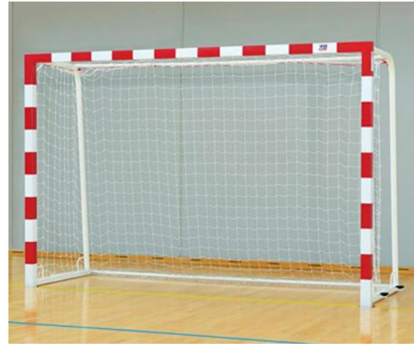
Buts de handball compétition acier peint bicolore avec 4 ancrages