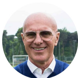
Arrigo Sacchi Italien

Si 88 % des entraîneurs à haut niveau sont d'anciens joueurs professionnels, certains font figure d'exception :