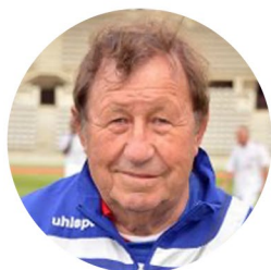
Guy Roux Français