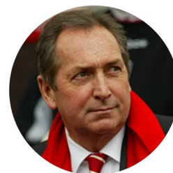
Gérard Houllier Français