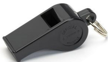
Sifflet plastique petit modèle Casal Sport

A bille liège, son médium. Coloris noir.