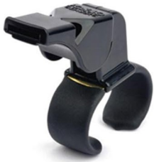
Sifflet Fox 40 doigt

Sifflet Fox avec attache au doigt. Son strident.