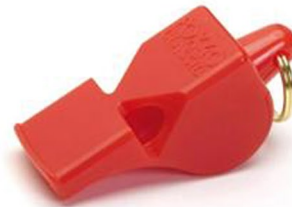
Sifflet Fox 40

Le sifflet le plus vendu au monde, une référence en matière de sifflet.