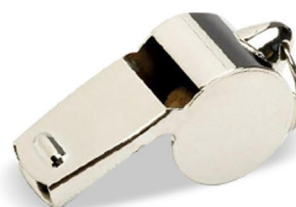
Sifflet métal chrome Casal Sport

A bille liège, son médium. Coloris noir.